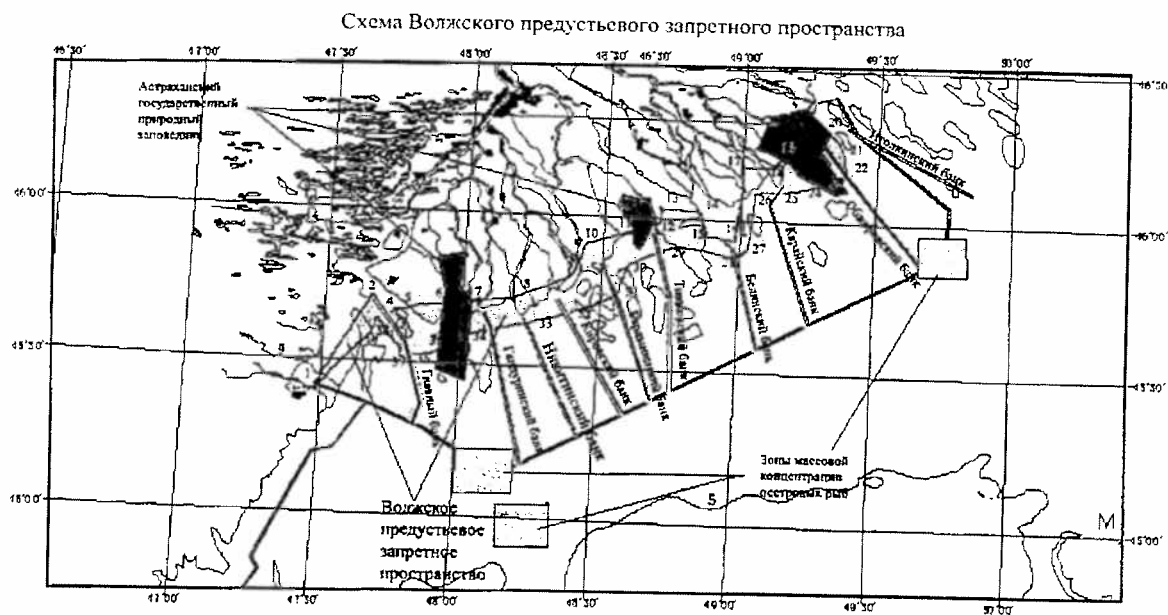
Схема Волжского предустьевоего запретного пространства